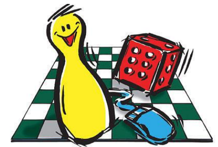
Spiel und Spaß