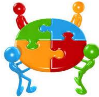
Gemeinschafts- und Persönlichkeitsbildung