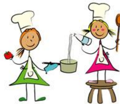
Kochen und Backen