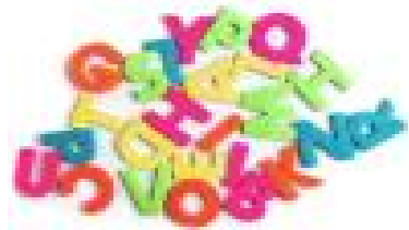
Fördern und Fordern