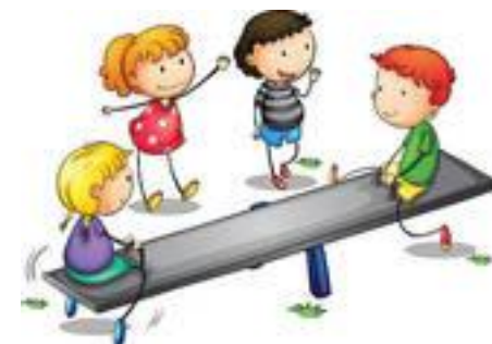
Spielen im Freien