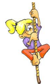
Sport und Bewegung