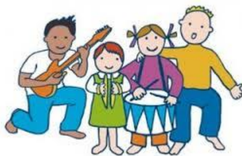
Musik und Tanz